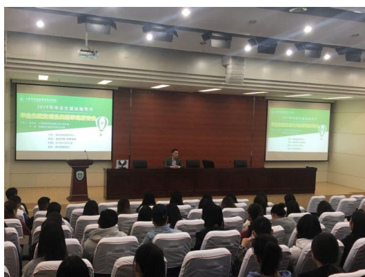
2019 就业创业典型事迹报告会

本专业主要就业面向是各类中小企业、金融行业、中介服务机构、非营利组织的出纳、会计核算、筹资管理、投资管理、成本管理、财务预算、财务控制、财务分析、财务咨询、税务筹划等工作岗位。例如江苏中央新亚百货股份有限公司、江苏沙钢集团淮钢特钢有限公司、淮安开元税务师事务所等。